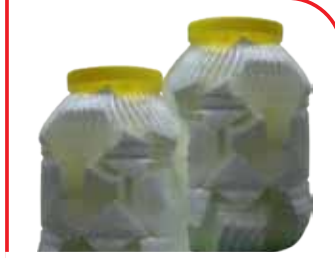
Elazığ Salamura Koyun ve Keçi Peyniri