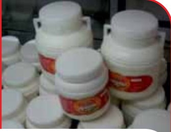
Elazığ Çaloğlu Tulum Peyniri