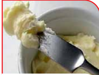
Elazığ Köy Tereyağı