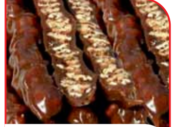
Elazığ Orcik Sucuk