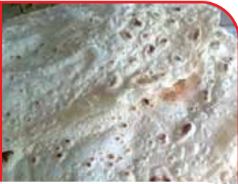
Elazığ Özensar Köy Yufkası

"2010 yılından beri Ankara, Keçiören, Kızılarpınarı caddesinde faaliyet gösteren şarküterimiz. Elazığ ve diğer tüm yöresel lezzetlerle, siz değerli müşterilerimizin hizmetindedir."