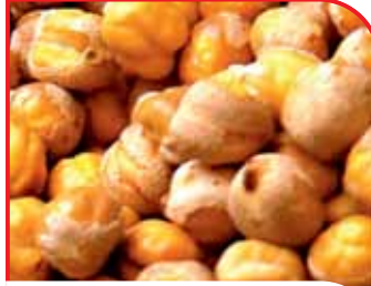
Elazığ Ağın Leblebisi