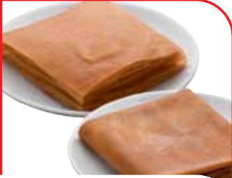
Elazığ Üzüm ve Dut Pestili