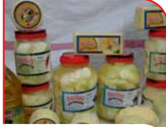
Elazığ Peytaş Salamura Peynir