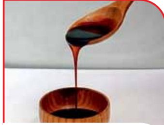
Elazığ Üzüm ve Dut Pekmezi